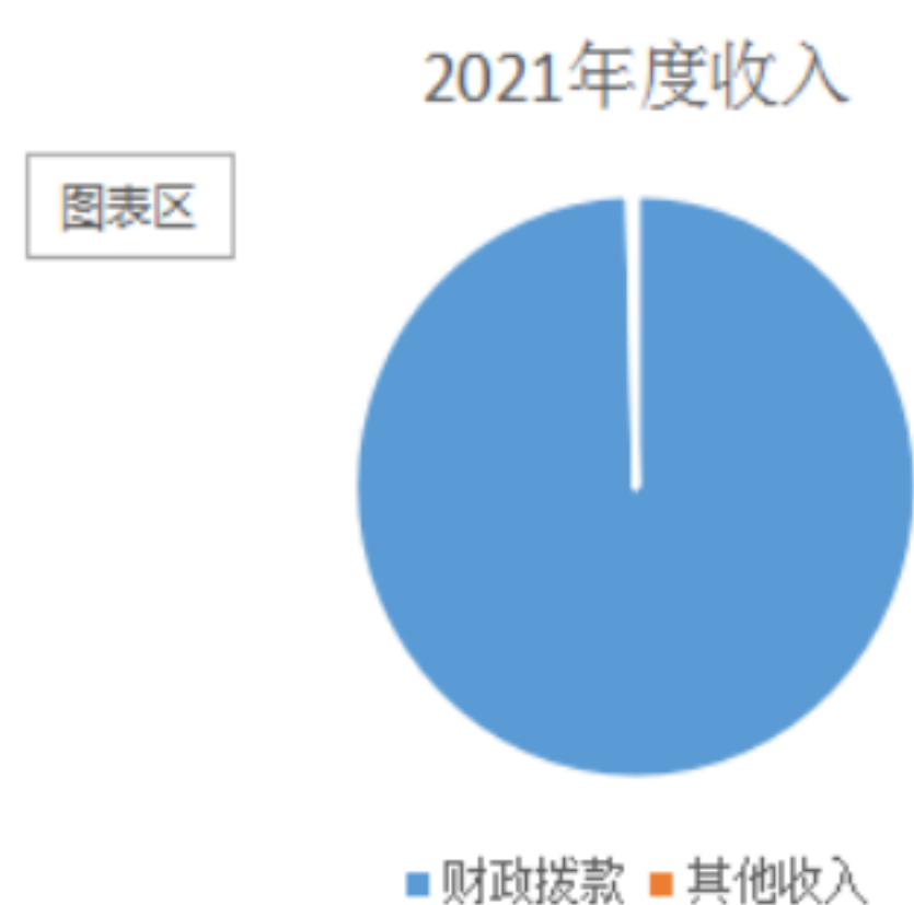
图 2: 收入决算结构

2021 年度收入合计 188.49 万元。其中：财政拨款收入 187.79 万元，占本年收入 99.63% ；其他收入 0.70 万元，占本年收入 0.37 %。区委编办主要使用一般公共预算财政拨款收入、其他收入两个科目。