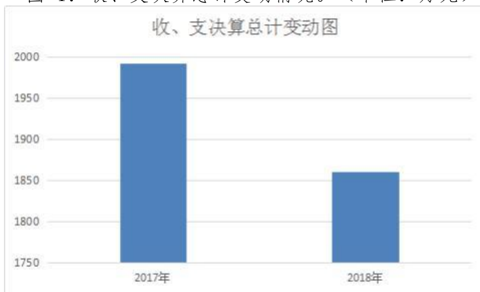
图 1：收、支决算总计变动情况。（单位：万元）

2018 年度收、支总计 1861.13 万元。与 2017 年相比，收、支总计各减少 131.63 万元，降低 6.6%，主要原因是：1. 大部分退休人员退休待遇由人社局统一发放，2. 个别项目由于完成工期等原因，未能在本年度付款。