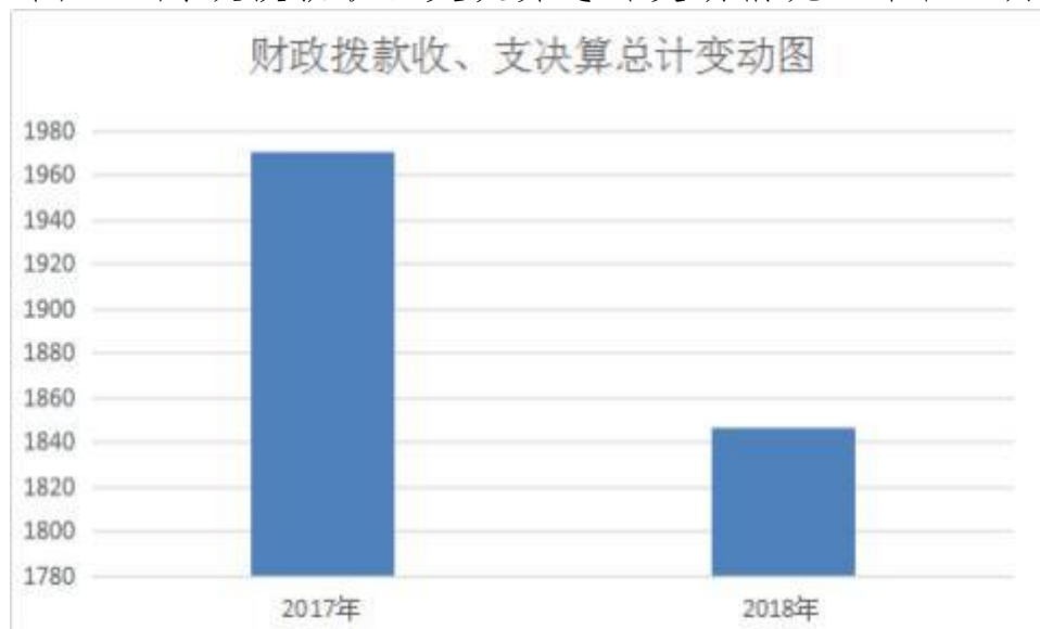
图 4：财政拨款收、支决算总计变动情况（单位：万元）

年相比，财政拨款收、支总计各减少 123.33 万元，降低 6.3%。主要原因是 1. 大部分退休人员退休待遇由人社局统一发放，2. 个别项目由于完成工期等原因，未能在本年度付款。