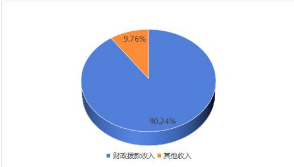
图 2: 收入决算结构