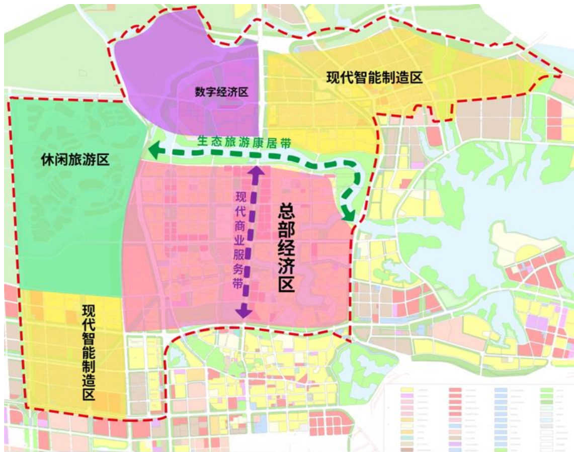
图2 径河街道“一城四区”的空间格局

“十四五”期间，径河街将加快推进新型工业化进程，以生态旅游康居带与现代商业服务带为引领，围绕现代智能制造区、总部经济区、数字经济区、休闲旅游区等重点区块，着力打造临空港生态新城，大力发展先进制造业和现代服务业。围绕城乡一体化和新农村建设，积极推进旧城改造、径河两岸整治、生态控制线保护改造，实现城乡面貌显著改观、城市功能不断完善，形成全面协调互动发展的新格局，打造“一城四区”空间格局。