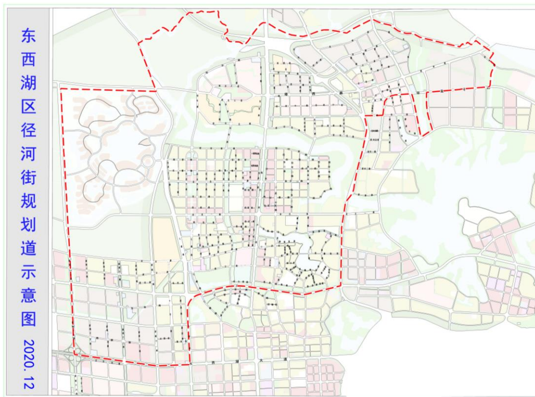
图3 径河街道交通规划示意图