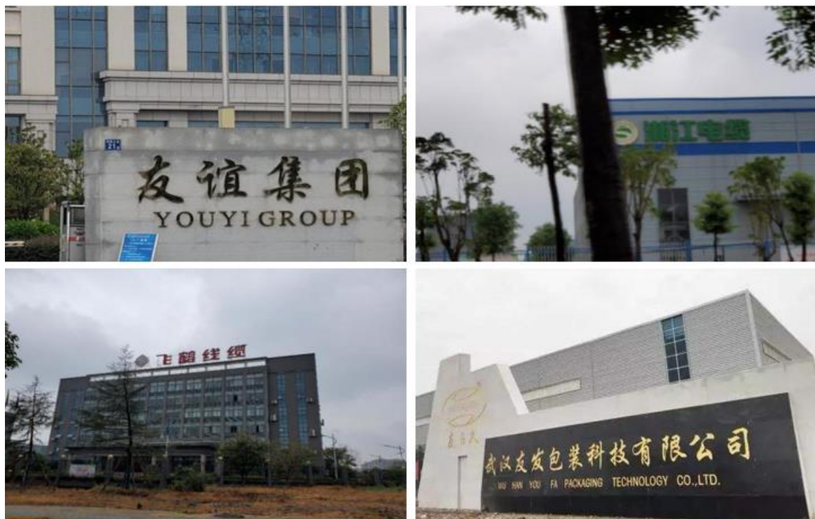
图 1 新沟镇街部分工业企业

里马（二期）、海推智能为代表的机械机电制造企业；以武汉建工为代表的装配式建筑企业；以航鑫电子为代表的航空航天企业；以蒙牛、旭东为代表的特色食品加工企业；以双龙药业、世吉药业、回盛生物为代表的医药企业；以友发包装、精碳伟业为代表的新材料企业。依托产业项目和重点企业，形成了电线电缆、机械制造、食品加工、新材料、生物医药等五大特色产业集群发展格局。科技创新能力显著增强，全街技改资金累计投入 7607 万元，高新技术企业数量达到 6 家（区内移交 1 家）。