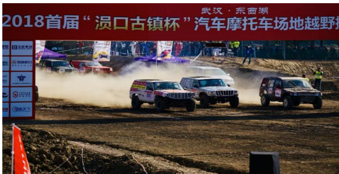
图 2 “浞口古镇杯”汽车摩托车越野挑战赛

本初农业、益源公司等 3 家农业龙头企业，浞水、行超、辉财、红海等 5 家农民专业合作社，农业产业化经营农户覆盖率达到 51.9%。乡村旅游繁荣发展，打造了沿总干沟 6000 亩休闲垂钓基地、二大队 1000 亩桃花观赏园、沿汉北河 5000 亩休闲采摘园，成功举办了 4 届桃花节、3 届浞口古街“百家宴”、1 届浞口古街赛车节。农业基础设施更加完善，实施了县河、浞口 660KV 泵站、农村排灌沟渠整治、小型农田水利建设等重点项目。