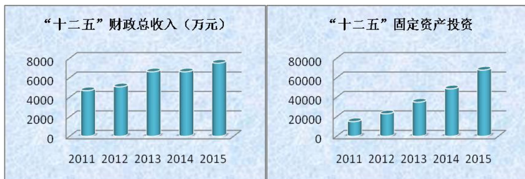
图 1：“十二五”主要经济指标增长示意图