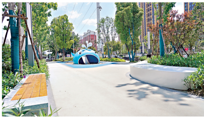
“梦花园”口袋公园。