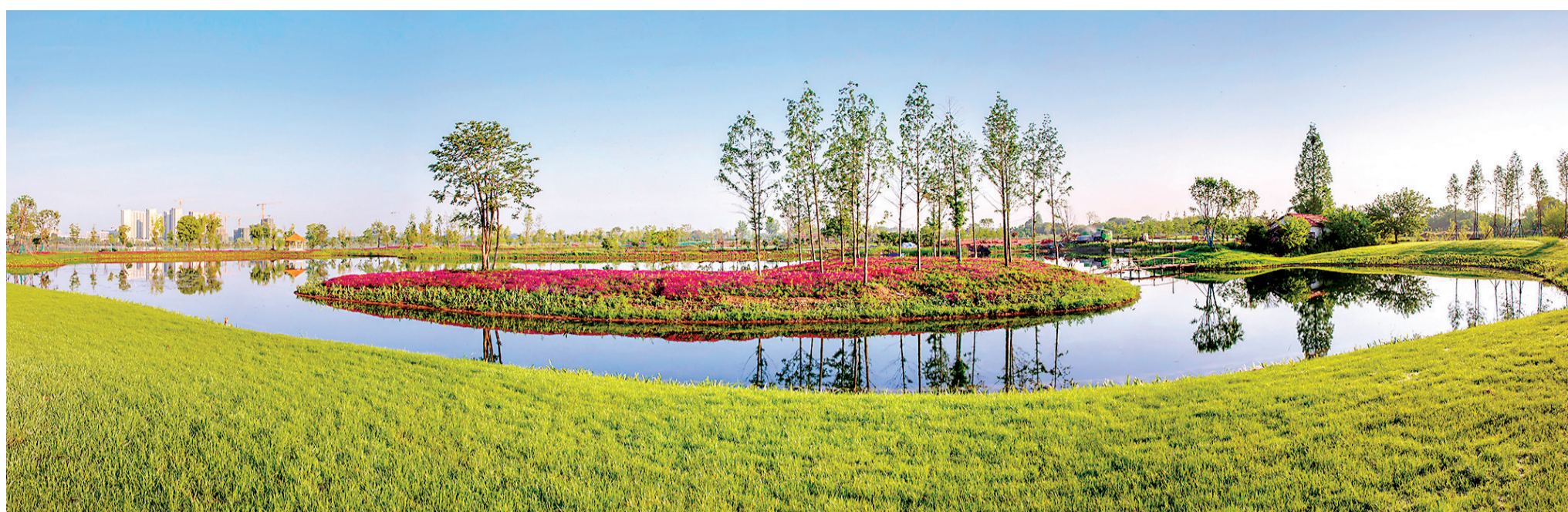
杜公湖国家湿地公园。