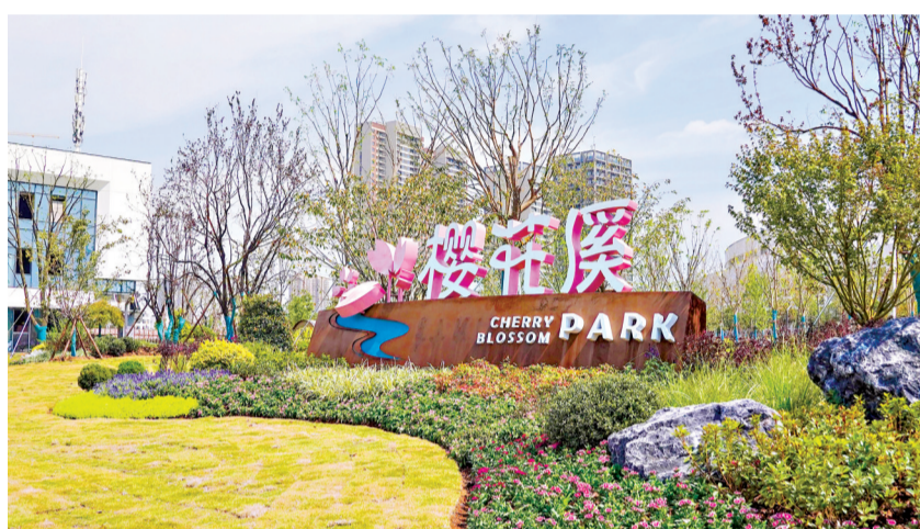
樱花溪公园。