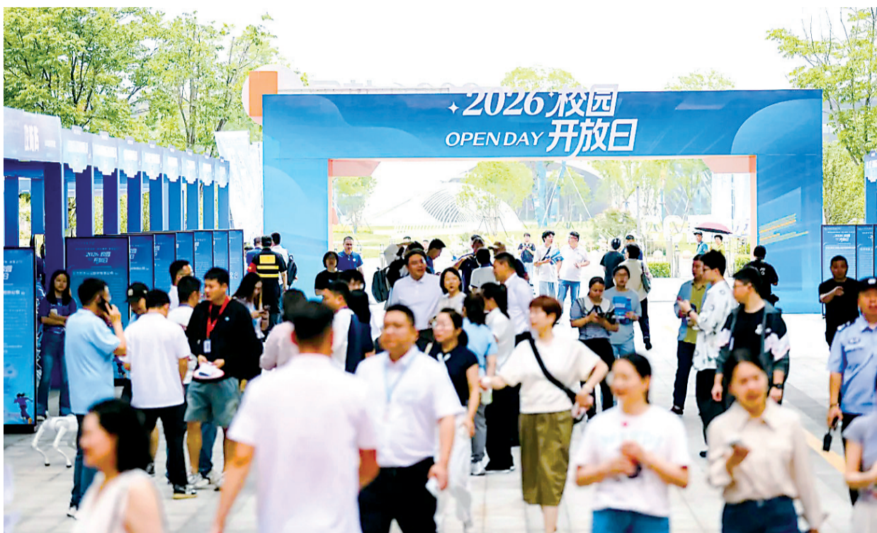
网络空间安全学院首次校园开放日,上万人次参观校园。