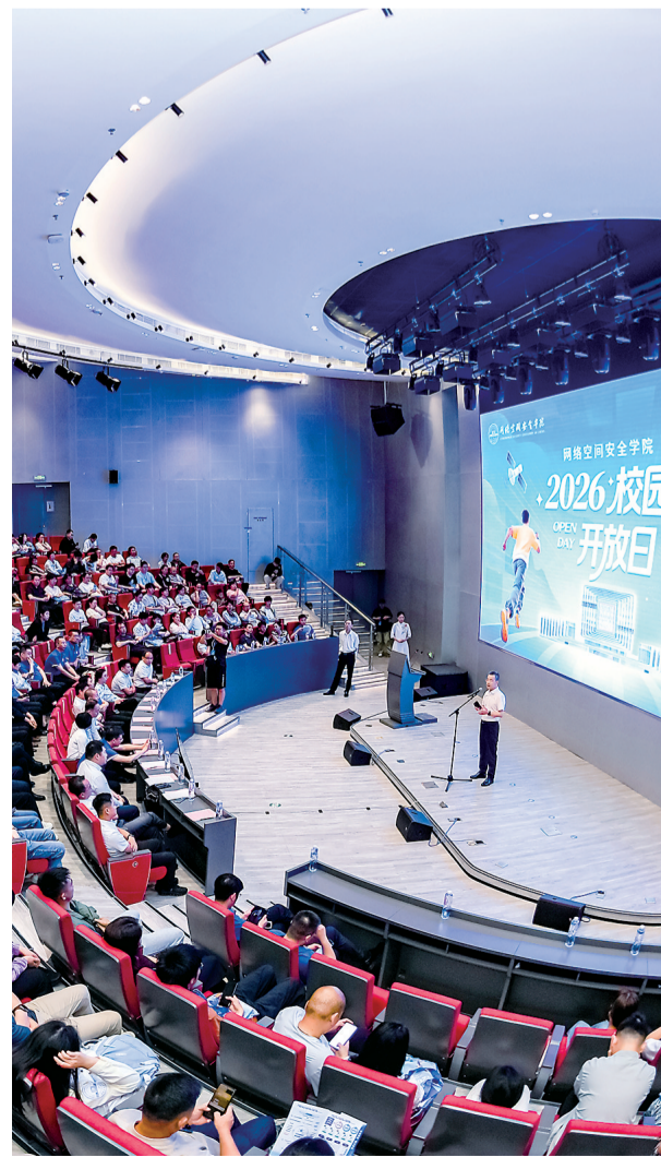
学校特设现场宣讲环节,向学生、家长解读招生政策与人才培养模式。

“前路漫漫亦灿灿”“所愿皆所成”“成为更好的自己”……明信片上,一笔一画写满了对知识与校园的憧憬。不积跬步,无以至千里。一个个真切的期盼,成为学子们在此向着目标全力奔跑的起点。