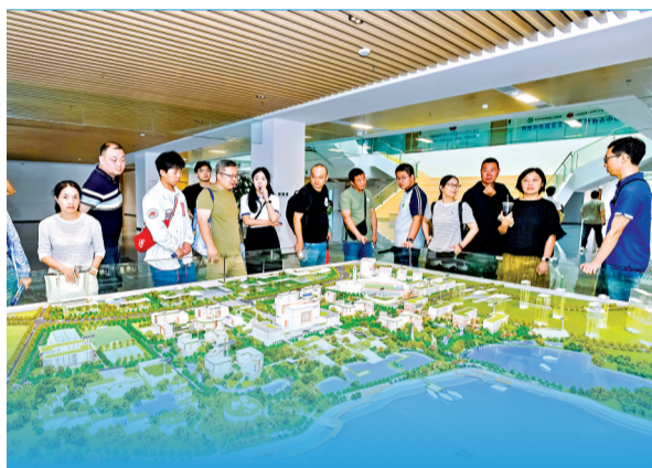
学生、家长参观杜公湖校区(正在建设中)沙盘。