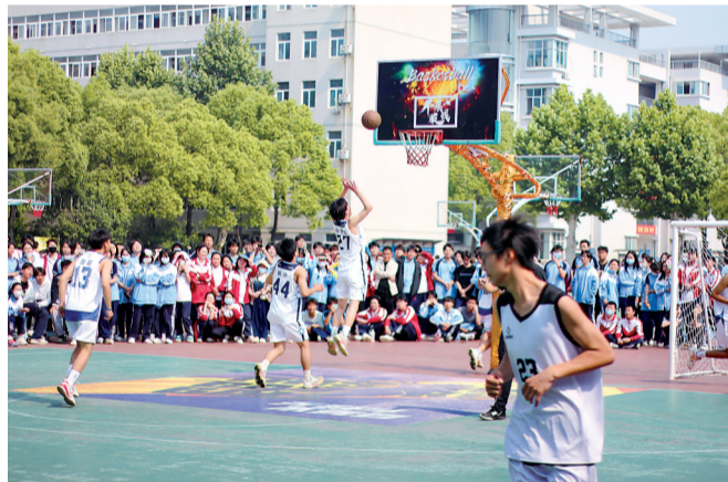
倡导每天阳光运动一小时，引导学生健康成长。图为校内篮球联赛。