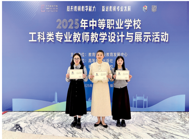
教师在2025年国家级教学设计与展示活动中斩获一等奖4个、二等奖3个、三等奖3个。图为工科类获奖教师合影。