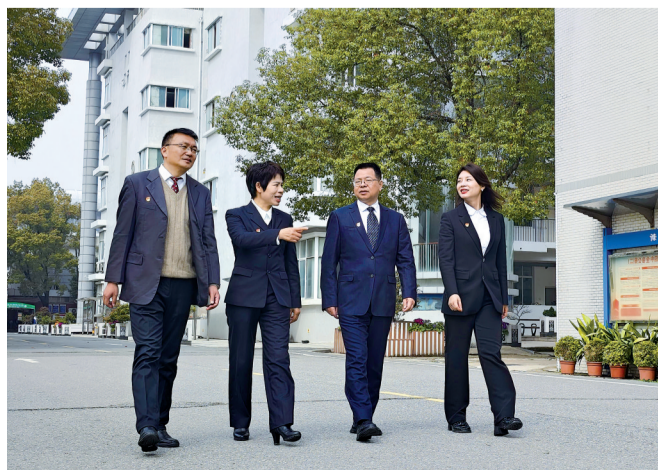
校领导研究学校“十五五”发展规划。