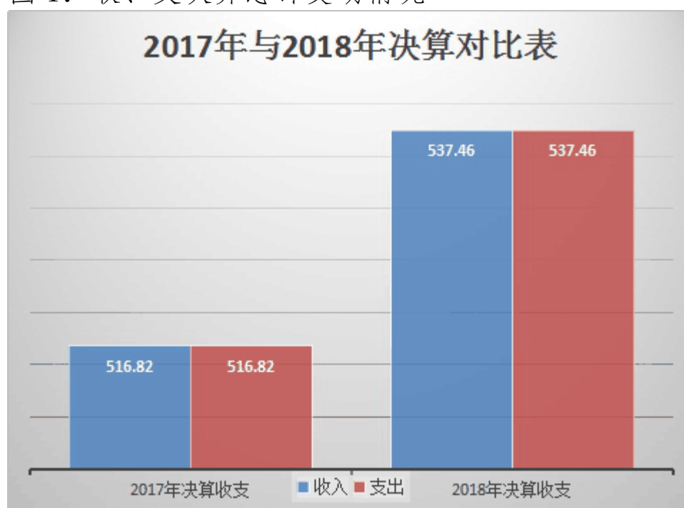
图 1：收、支决算总计变动情况

2018 年度收、支总计 537.46 万元。与 2017 年相比，收、支总计各增加 20.64 万元，增长 3.84%，主要原因是人员经费增加。