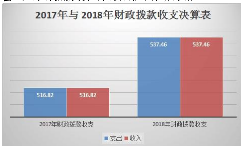
图 4：财政拨款收、支决算总计变动情况